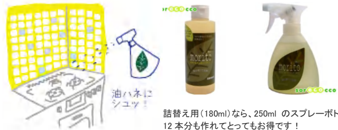
詰替え用(180ml)なら、250mlのスプレーボトル12本分も作れてとってもお得です！

泡切れも良いので、すすぎの水の量も少なく済みますが、その水も自然の力できれいにしてくれるなんて、他の洗剤にはありません。洗浄成分そのものも、全量のわずか1/25が含まれるだけ。甘草エキスも配合されていて、洗いの後の肌も、優しく守ってくれます。