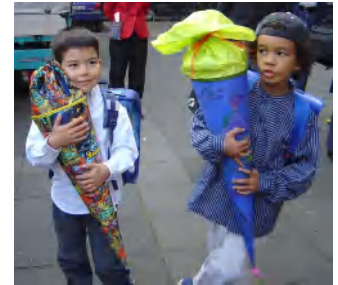
小学校の入学式の様子:

新入生は皆、親の手作りや既製のシュール・テューテ(写真・円錐形の袋)を持って入学式に参加。中には、子どもの好きなお菓子や文房具が入っていて、この袋を抱きしめて学校初日の不安を和らげる。教室で袋を開けクラスメートと中身の自慢大会をすれば、もう怖いものなし。