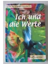
※1: 太朗(中1)の道徳の教科書