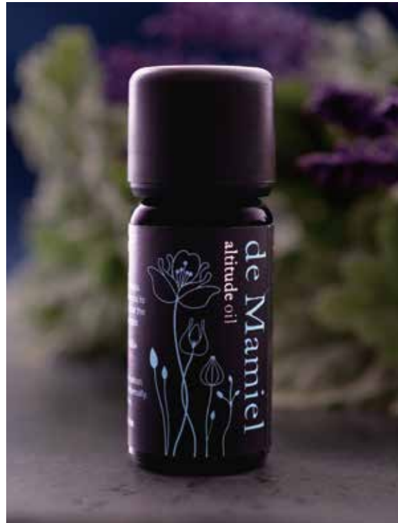
デ・マミエール アルティテュードオイル (高濃度精油ブレンドオイル) 【内容量】 10ml 【希望小売価格】 6,000円(税抜)

デ・マミエールブランドの考え方の骨子の1つである中医学では、 秋は、空気は透明さを増し、自然界のすべてのものは熟して実りを結ぶ、安定の時期。 この時期、天気は清々しく過ごしやすくなりますが、意外と体調や肌のバランスを崩す人も多いもの。 アルティテュードオイルで、ゆっくりと秋のセルフケアをしてみませんか。