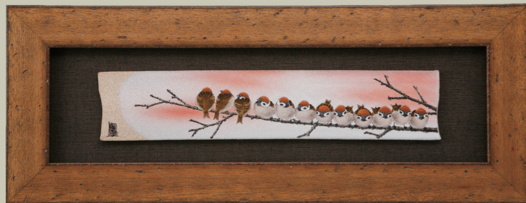
T-162 古木調額(長中)・群雀図⑫ (額縁寸法: 縦 23.5× 横 61.5cm・紙箱) ¥100,000 (税別)