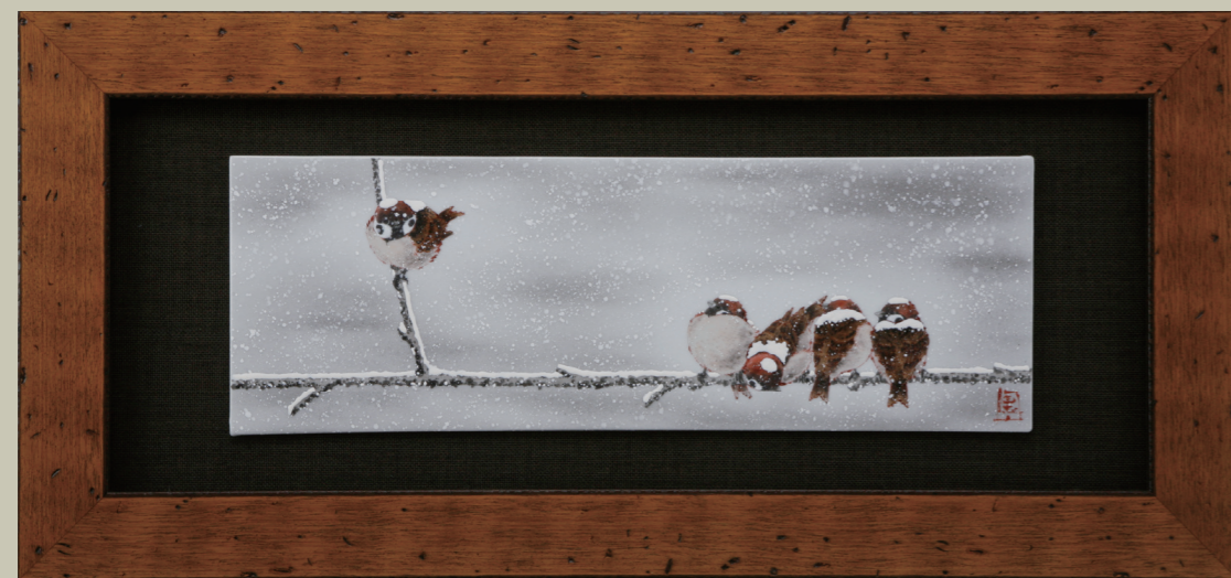
T-168 古木調額(長平大)・雪雀図⑤ (額縁寸法: 縦 31.5× 横 67.5cm・紙箱) ¥150,000 (税別) [限定品]