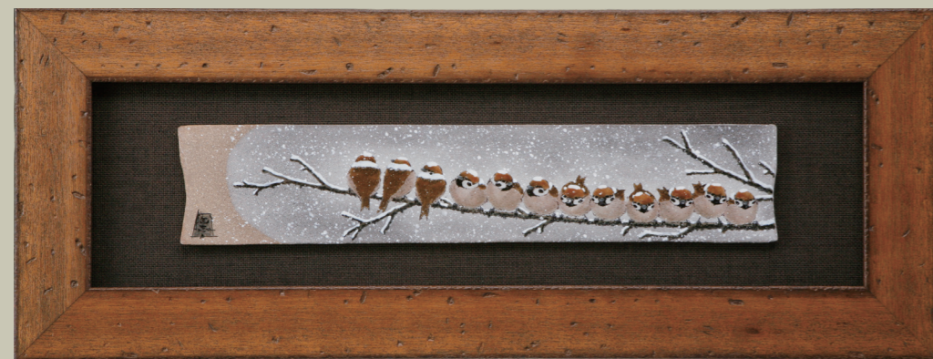
T-141 古木調額(長中)・雪雀図⑬ (額縁寸法: 縦 23.5× 横 61.5cm・紙箱) ¥120,000 (税別)