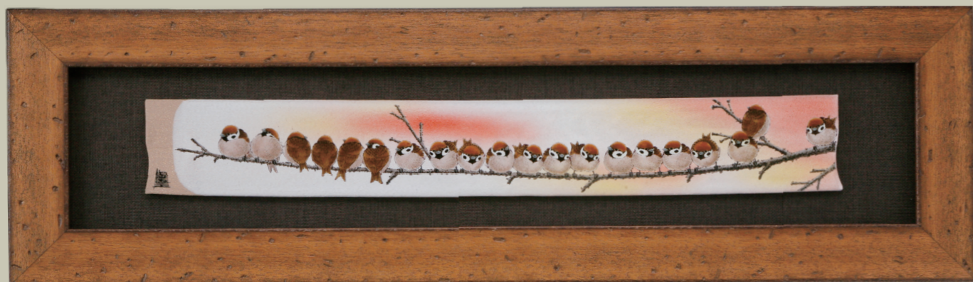
T-167 古木調額(長大)・群雀図⑩ (額縁寸法: 縦 23.5× 横 83.5cm・紙箱) ¥200,000 (税別)