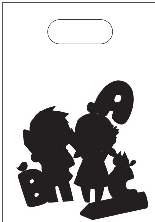
ホワイト版はグレースケールで作成します。 K100% で指定してください。

ホワイト版（白インク）用のデータは CMYK の印刷用データとは別にファイルを用意する必要があります。