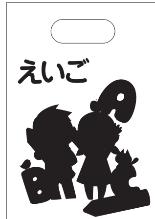
白あたり以外の箇所に白を使う場合も、 同じデータで指定することが可能です。

入稿の際は、「CMYK 版データ」と「ホワイト版データ」の2つのファイルをお送りください。